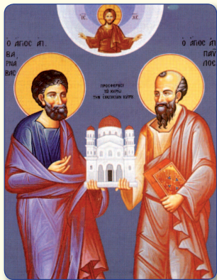
Οι Απόστολοι Βαρνάβας και Παύλος, ιδρυτές της Εκκλησίας της Κύπρου κατά την Α' Αποστολική περιοδεία.

ποίησή της, έρχεται να δώσει μια νέα συνέχεια στον τεράστιο ρόλο, που διαδραμάτισε στο μακρό διάστημα των χιλίων διακοσίων και είκοσι χρόνων λειτουργίας της. Οι ιστορικές της απαρχές σηματοδοτούνται με το έργο και τη θεοφιλή δράση και κατάληξη του πρώτου και μεγάλου Επισκόπου της, του και πρώτου Αρχιεπισκόπου Κύπρου, Αγίου Ηρακλειδίου. Αλλά και η ανάδειξη περισσότερων από τριάντα επωνύμων αγίων, αποδεικνύει το σημαντικό της ρόλο στα πνευματικά και αγιολογικά θέματα της περιοχής Ταμασού, της Εκκλησίας Κύπρου και σύνολης της Ορθόδοξης Εκκλησίας μας.