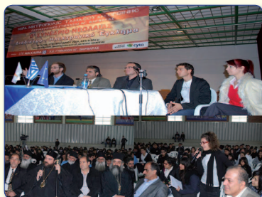
Στιγμιότυπο από το Β' Συνέδριο Νεολαίας με θέμα: «Διαδίκτυο – Ηλεκτρονικό Έγκλημα».