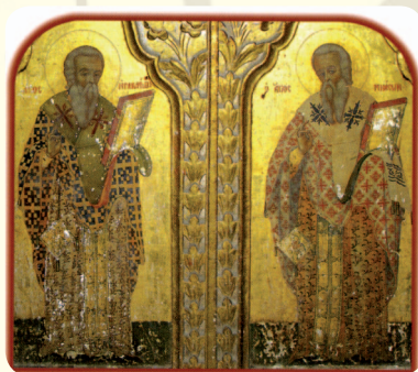
Οι Άγιοι Ηρακλείδιος και Μνάσωνας. Λεπτομέρεια από τα βημόθυρα της Ιεράς Μονής Αγίου Παντελεήμονος Αχερά.

Στα βυζαντινά χρόνια, αλλά σε ακαθόριστη χρονολογία, υπηρέτησαν επί-