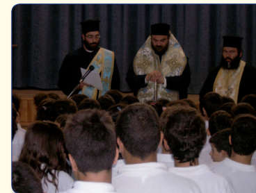
Ο Πανιερωτάτος Μητροπολίτης Ταμασού και Ορεινής κ. Ησαΐας ενώ τελεί την ακολουθία του Αγιασμού σε Σχολείο.

Από την άλλη, ο Όμιλος Νεολαίας «Φέρελις» έχει την ευθύνη της διοργάνωσης των Συνεδρίων Νεολαίας, του Πρωταθλήματος Φούτσαλ των Κατηχητικών Σχολείων της Μητροπόλεως και των διάφορων πολιτιστικών εκδηλώσεων, όπως είναι οι προβολές ταινιών της κυπριακής παραδόσεως στις κοινότητες της Μητροπόλεως καθώς και η πραγματοποίηση συναυλιών.