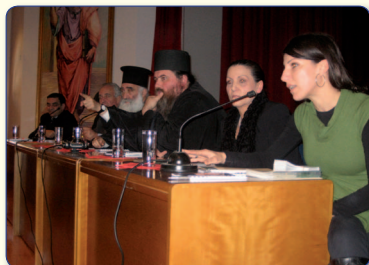
Στιγμιότυπο από το Α' Συνέδριο Νεολαίας με θέμα: «Νέοι: Ελευθερία και Εξαρτήσεις».

Η Ιερά Μητρόπολις Ταμασού και Ορεινής στα πρώτα αυτά χρόνια επαναδραστηριοποίησής της, προσπάθησε να αγκαλιάσει σχεδόν όλους τους