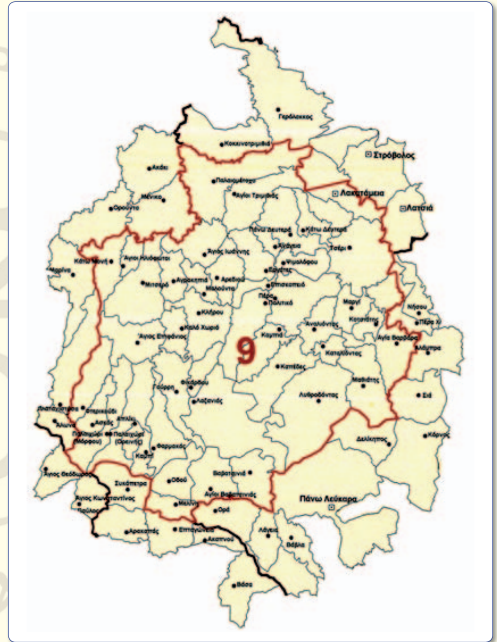
Ο χάρτης της Μητροπολιτικής Περιφέρειας Ταμασού και Ορεινής.