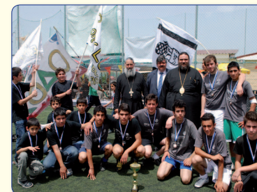
Ο Πανιερωτάτος μαζί με τη νικήτρια ομάδα του Πρωταθλήματος Φούτσαλ της Μητροπόλεώς μας «Μάριος Καραλλάκης 2010», αυτή της Οδού.