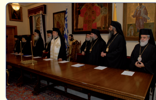
Στιγμιότυπο από την έναρξη της Κληρολαϊκής Συνέλευσης, η οποία άρχισε τις εργασίες της με προσευχή στο Μέγα Συνοδικό της Ιεράς Αρχιεπισκοπής. Διακρίνονται η Α.Μ. ο Αρχιεπίσκοπος κ.κ. Χρυσόστομος και οι Πανιερώτατοι Μητροπολίτες Μόρφου κ. Νεοφύτου και Κύκκου και Τηλλυρίας κ. Νικηφόρου (δεξιά), Κωνσταντίας κ. Βασιλείου και ο Χωρεπίσκοπος Καρπασίας κ. Χριστοφόρος (αριστερά).

Η Εκλογική Κληρολαϊκή Συνέλευση πράγματι συνήλθε στην πιο πάνω ορισθείσα ημερομηνία στο Μέγα Συνοδικό της Ιεράς Αρχιεπισκοπής και, ύστερα από τις νενομισμένες διατάξεις και την ανάπεμψη ειδικής δέησης, ο Προκαθήμενος της Συνέλευσης, Μακαριώτατος Αρχιεπίσκοπος κ.κ. Χρυσόστομος Β', κάλεσε τα Μέλη της να αναδείξουν με μυστική ψηφοφορία τον άξιο Επίσκοπο της Μητροπόλεως Ταμασού και Ορεινής. Ακολούθησε η ψηφοφορία και το αποτέλεσμα ήταν η παμψηφεί εκλογή