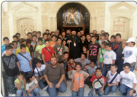
Αναμνηστική φωτογραφία του Πανιερωτάτου μαζί με τα παιδιά της Κατασκήνωσης Αρρένων της Μητροπόλεως στον περίβολο του Ιερού Ναού Τιμίου Σταυρού Ομόδους.

Τέλος, να αναφέρουμε ότι ο Πανιερώτατος Μητροπολίτης μας συμμετέχει εκ μέρους της Συνόδου της Εκκλησίας της Κύπρου σε διάφορα Συνέδρια σε όλο τον κόσμο και είναι υπεύθυνος του Τμήματος Εξωτερικής Ιεραποστολής της Εκκλησίας της Κύπρου. Επίσης είναι πρόεδρος του ΚΕΝΘΕΑ Κύπρου, το οποίο δραστηριοποιείται κατά των εξαρτησιογόνων ουσιών.