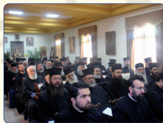
Αποψη από Ιερατική Σύναξη.

λώσεις και δραστηριότητες της Μητροπόλεως που σκοπεύονται να πραγματοποιηθούν.