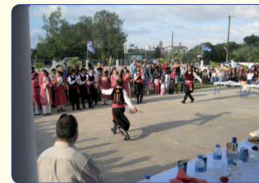
Στιγμιότυπο από τα παραδοσιακά παιχνίδια που διοργανώνει η Μητρόπολη στον Καθεδρικό Ναό του Αγίου Νικολάου στο Επισκοπεϊό την Δευτέρα του Πάσχα.