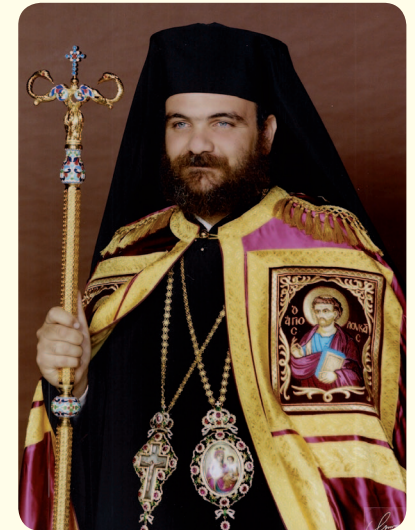
Ο Πανιερώτατος Μητροπολίτης Ταμασού και Ορεινής κ. Ησαΐας.

Κατά την περίοδο του Βυζαντίου, η Εκκλησία της Κύπρου απολάμβανε τα προνόμια του Αυτοκεφάλου της, και ο εκάστοτε Αρχιεπίσκοπός της έπαιρνε τιμητικά δώρα από τους αυτοκράτορες. Αυτή τη χρονική περίοδο, πολλά μοναστήρια και εκκλησίες ιδρύονται από τους αυτοκράτορες στο νησί, ως αντάλλαγμα των ιερών θησαυρισμάτων που μεταβαίνουν στην Κωνσταντινούπολη, όπως είναι το λείψανο του Αποστόλου Βαρνάβα και του Αγίου Λαζάρου. Κατά τους 11ο με 13ο αιώνες ιδρύονται τα τρία περίφημα ανά το παγκόσμιο σταυροπηγιακά μοναστήρια, αυτά της Παναγίας του Κύκκου, της Παναγίας του Μαχειρά και του Αγίου Νεοφύτου. Ιδιαίτερα, το μοναστήρι της Παναγίας του Κύκκου, λόγω και της περίφημης εικόνας της Παναγίας, έργο του Αποστόλου Λουκά, αναδεικνύεται σε πανορθόδοξο προσκύνημα. Επειδή δεν υπήρχαν οι σημερινές ευκολίες των συγκοινωνιών, η Μονή ίδρυσε σε πολλές χώρες του εξωτερικού μετόχια, για να μπορούν εκεί να μεταβαίνουν οι πιστοί και να προσκυνούν το αντίγραφο της εικόνας της Παναγίας του Κύκκου. Είναι πολύ γνωστά τα μετόχια που διατηρούσε η Μονή,