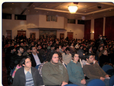
Αποψη από τους μαθητές που συμμετείχαν στις εργασίες του Α' Συνεδρίου Νεολαίας.

τομείς του πνευματικού, πολιτιστικού και αθλητικού χώρου, δίνοντας έτσι την ευκαιρία στο ποιμνιό της να έχει μια αμεσότερη επαφή με τη θεσμική Εκκλησία και να απολαμβάνει τα θετικά στοιχεία της ανασύστασής της.