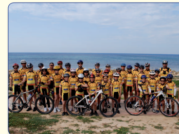
Αμνηστική φωτογραφία του Ποδηλατικού Ομίλου «Άγιος Μνάσων».