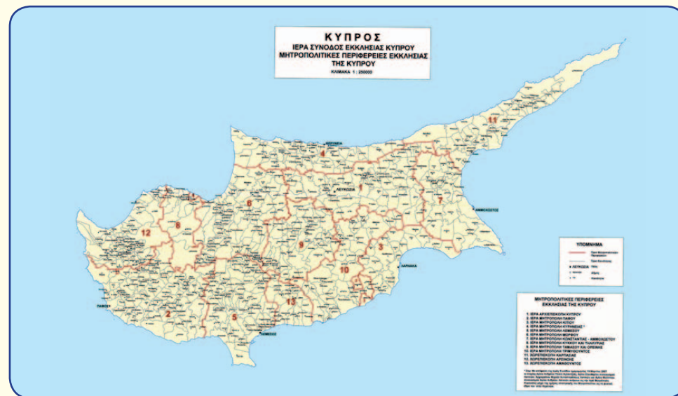
Ο χάρτης της Κύπρου, όπως διαμορφώθηκε με τις νέες Μητροπόλεις και Επισκοπές.

Αποτελεί θεοπρεπές και ιστορικό γεγονός η απόφαση της Ιεράς Συνόδου της Εκκλησίας Κύπρου (Δευτέρα, 12 Φεβρουαρίου 2007) να επανασυστήσει την αρχαία Μητρόπολη Ταμασού, με την ονομασία Ιερά Μητρόπολη Ταμασού και Ορεινής, όπως και τις Μητροπόλεις Κωνσταντίας και Τριμυθούκτου, καθώς, επίσης, και τη δημιουργία της Μητροπόλεως Κύκκου και Τηλλυρίας. Αναμφίβολα και η ανασύσταση των Επισκοπών Καρπασίας, Αμαθούντος, Λήδρας και Χύτρων σηματοδοτεί την επαναφορά του πλήρους αρχαίου Συνοδικού συστήματος της Εκκλησίας μας.