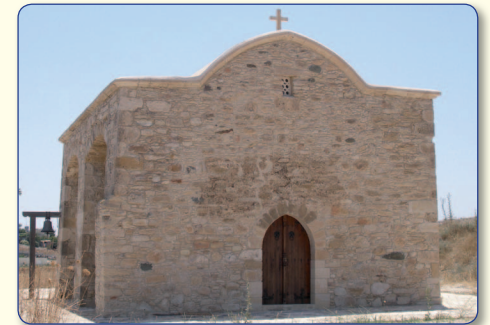
Το εκκλησάκι του Αγίου Μνάσωνα πλησίον του χωριού Πολιτικό. Στα παλαιότερα χρόνια, όπως μας πληροφορεί ο Ρώσος περιηγητής Βασίλειος Μπάρσκυ, αποτελούσε το καθολικό Μονής προς τιμήν του Αγίου Μνάσωνα.

Ιερά λείψανα του Αγίου υπάρχουν σε πολλά μοναστήρια της Κύπρου. Στη Μονή του Κύκκου, του Μαχαιρά. Στο Ναό του χωριού Πολιτικό σώζεται μικρή εικόνα η οποία φέρει τεμάχιο του λειψάνου του Αγίου. Επίσης ο χρονογράφος Αρχιμανδρίτης Κυπριανός αναφέρει ότι ο βραχίον του Αγίου βρίσκεται αποθησαυρισμένος στο Ναό του χωριού Ποταμιού της επαρχίας της Λεμεσού. Αυτόν τον Άγιο τον «αρχαίο μαθητή» τον οποίο οι Πράξεις των Αποστόλων μνημονεύουν ως συνέστιον και συνεργάτη των Αγίων Αποστόλων (Πρ. 21,16), επικαλούμαστε, για να στηρίζει και να ενδυναμώνει τον ποιμενάρχη και διάδοχο, στο θρόνο του Ησαΐα και να τον καταστήσει και τρόπων διάδοχο, χαρίζοντας σ' αυτόν υπομονή και κάθε επιτήδειο προς την εκπλήρωση του ποιμαντορικού του έργου.