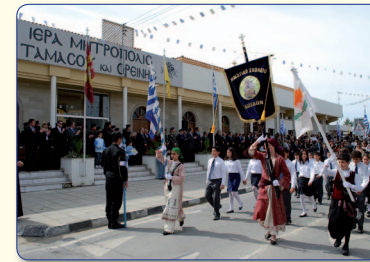
Αποψη από την παρέλαση που διοργανώνει η Μητρόπολη με την ευκαιρία των εθνικών επετείων της 25ης Μαρτίου 1821 και της 1ης Απριλίου 1955.