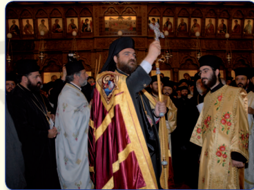
Ο Μητροπολίτης Ταμασού και Ορεινής κ. Ησαΐας, ενώ ευλογεί το πλήθος των πιστών, κατά την άφιξή του στον Καθεδρικό Ναό του Αγίου Νικολάου Επισκοπείου.