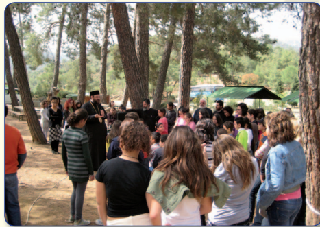
Στιγμιότυπο από την εκδρομή των θηλέων των Κατηχητικών Σχολείων της Μητροπόλεως.