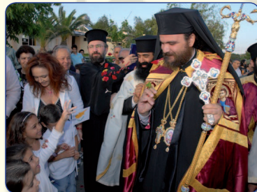
Στιγμιότυπο από την άφιξη του νέου Μητροπολίτου κ. Ησαΐα.