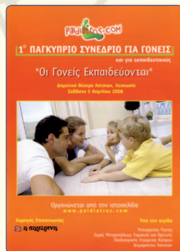
Η αφίσα του Παγκύπριου Παιδιατρικού Συνεδρίου για Γονείς και Εκπαιδευτικούς.