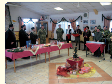
Στιγμιότυπο κατά την επίσκεψη του Πανιερωτάτου σε στρατόπεδα.