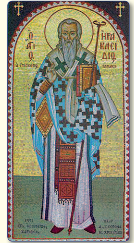
Ο Άγιος Ηρακλείδιος.

Όταν κοιμήθηκε ο Άγιος Ηρακλείδιος, το σώμα του τάφηκε στη σπηλιά, που τελούσε τα μυστήρια, στο χώρο, όπου αργότερα κτίστηκε βασιλική και Μονή προς τιμήν του, η οποία υπάρχει μέχρι σήμερα. Η μνήμη του Αγίου Ηρακλείδιου, του πολιούχου Αγίου της Μητροπόλεώς μας, τιμάται στις 17 Σεπτεμβρίου.