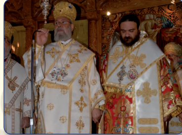
Η άκρως συγκινητική στιγμή της Χειροτονίας «Άξιος», προτείνει ο Αρχιεπίσκοπος και ο λαός αναφωνεί ομόθυμα «Άξιος»!