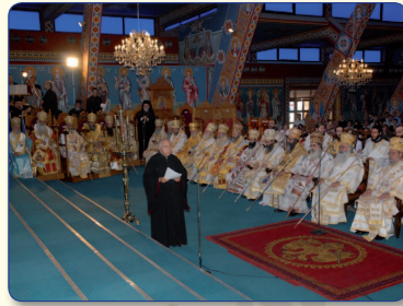
Άποψη της χορείας των Ιεραρχών, οι οποίοι πήραν μέρος στη Θεία Λειτουργία και στη Χειροτονία.

Στον καθορισμένο χώρο ο Ιερός Κλήρος, οι Μοναχοί και οι Μονάζουσες των Ιερών Μονών, οι Πρόεδροι των κοινοτήτων, εκπρόσωποι πολιτικών κομμάτων, οι Αστυνομικές και Στρατιωτικές αρχές, οι μαθητές των σχολείων, καθώς, επίσης, και πλήθος κόσμου ανέμεναν το Μητροπολίτη κ. Ησαΐα και τους άλλους Αρχιερείς. Ακολούθως όλη η ιερή πομπή κατευθύνθηκε προς τον Καθεδρικό Ναό του Αγίου Νικολάου Επισκοπείου.