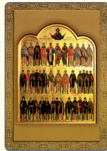
Η εικόνα των Ταμασέων Αγίων, οι οποίοι τιμώνται την 1η Μαΐου.

Με απόφαση της Ιεράς Συνόδου της Εκκλησίας της Κύπρου (12 Φεβρουαρίου 2007), έγινε ανασύσταση της Ιεράς Μητροπόλεως Ταμασού και Ορεινής. Στις 9 Ιουνίου 2007 εξελέγη παμψηφεί Μητροπολίτης Ταμασού και Ορεινής ο αρχιμανδρίτης Ησαΐας Κυκκώτης. Η χειροτονία του κ. Ησαΐα έγινε στις 11 Ιουνίου του ίδιου έτους, ημέρα μνήμης του ιδρυτή της Εκκλησίας της Κύπρου αποστόλου Βαρνάβα, στον ιερό ναό Αποστόλου Βαρνάβα Δασουπόλεως, και η ενθρόνισή του την ίδια ημέρα στον καθεδρικό ναό Αγίου Νικολάου Επισκοπείου.