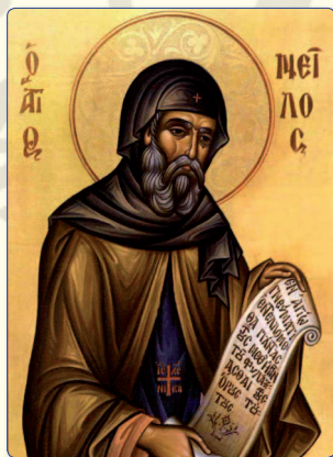
Ο Όσιος Νείλος, τελευταίος Επίσκοπος Ταμασού και ιδρυτής της Ιεράς Μονής Μαχαιρά.

Κατά το ισχύον σύστημα και με βάση τον Καταστατικό Χάρτη της Εκκλησίας Κύπρου, η Ιερά Σύνοδος, στις 19 Μαρτίου και 12 Απριλίου 2007, υλοποιούσε την απόφασή της για διεξαγωγή εκλο-