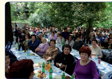
Στιγμιότυπο από την εκδρομή των Χριστιανικών Συνδέσμων Γυναικών στην Ιερά Μονή Κύκκου.

Ακόμη, κάθε χρόνο την ημέρα μνήμης των Τριών Ιεραρχών, στις 30 Ιανουαρίου, η Μητρόπολή μας τελεί μνημόστυνο στη μνήμη