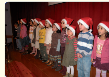
Στιγμιότυπο από τη Χριστουγεννιάτικη γιορτή της Μητροπόλεως.